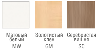
Матовый белый MW Золотистый клен GM Серебристая вишня SC